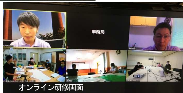
オンライン研修画面