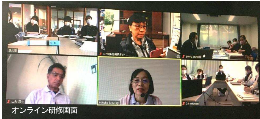
オンライン研修画面

令和2年8月からオンラインでマネジメント研修を、福岡県内4つの地域で開催いたしました。