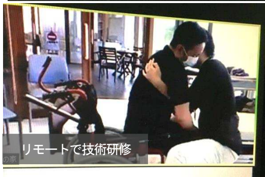
リモートで技術研修